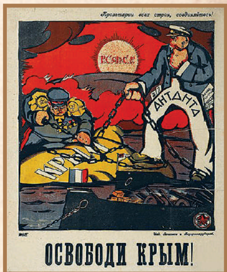
Плакат «Освободи Крым».