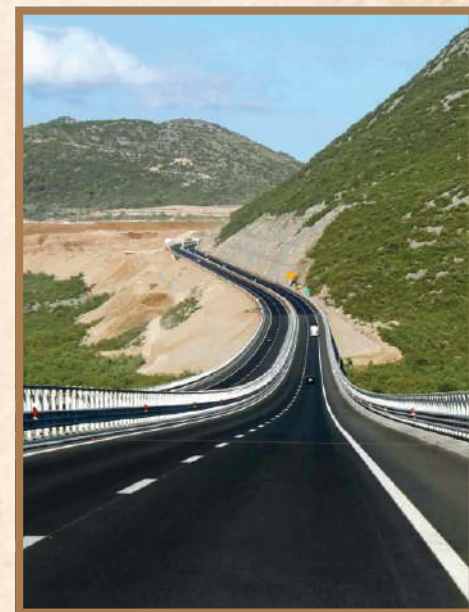
Федеральная трасса «Таврида».

За минувшие пять лет, с момента воссоединения Крыма и Севастополя, проделана огромная работа по интеграции полуострова и его социально-экономической структуры в Российскую Федерацию. В региональном развитии постепенно устраняются диспропорции, уровень жизни приближается к среднероссийскому, и формируются условия по обеспечению устойчивого экономического роста новых субъектов Федерации. Проводятся важные и значимые мероприятия по гармонизации межнациональных отношений и устранению межэтнических конфликтов, по развитию туристско-рекреационного и культурного потенциала Республики Крым и города Севастополя.