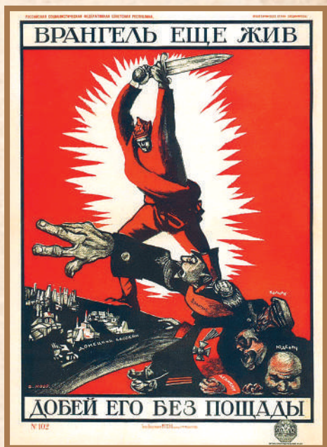
Плакат «Врангель еще жив. Добей его без пощады».