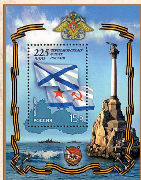
Почтовый блок с маркой 2008 года, посвященной 225-летию Черноморского флота России.