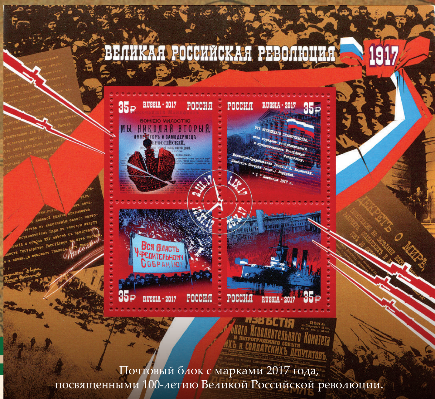
Почтовый блок с марками 2017 года, посвященными 100-летию Великой Российской революции.