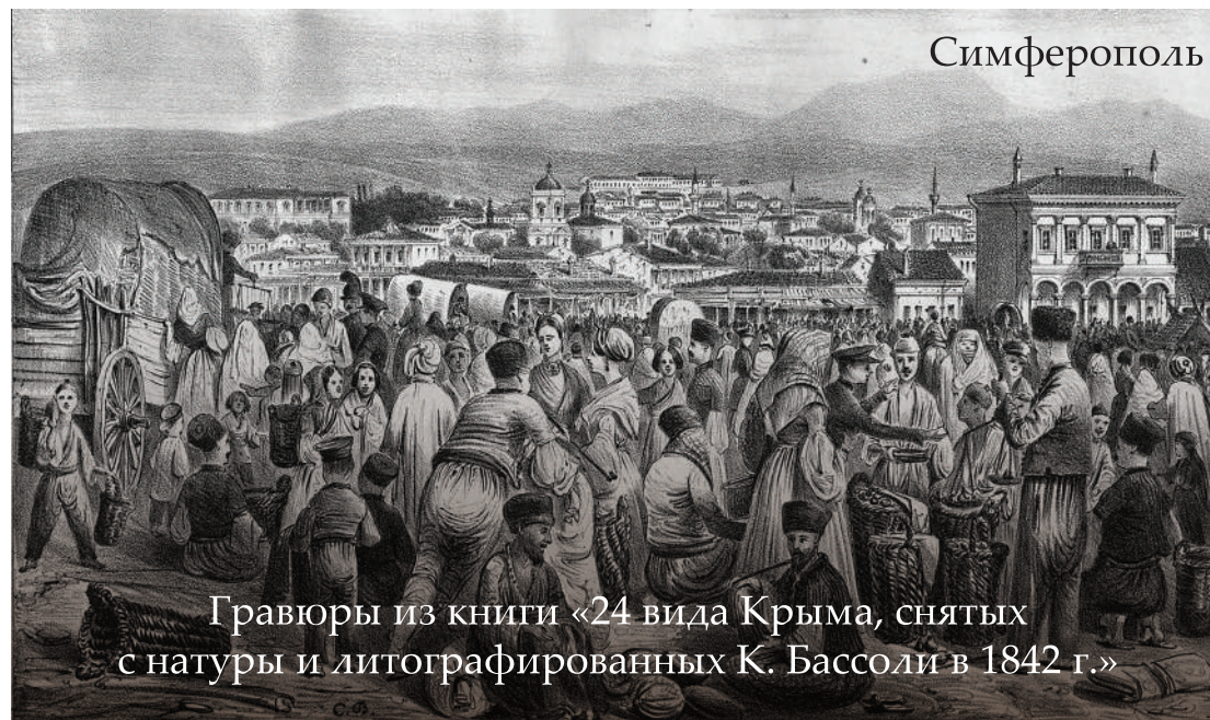
Гравюры из книги «24 вида Крыма, снятых с натуры и литографированных К. Бассоли в 1842 г.»