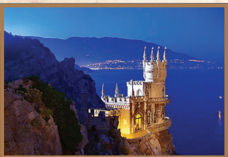
Дворец «Ласточкино гнездо» и мыс Ай-Тодор (близ Гаспри).