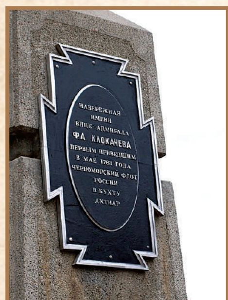
Памятный знак в честь Ф.А. Клокачева в Севастополе.