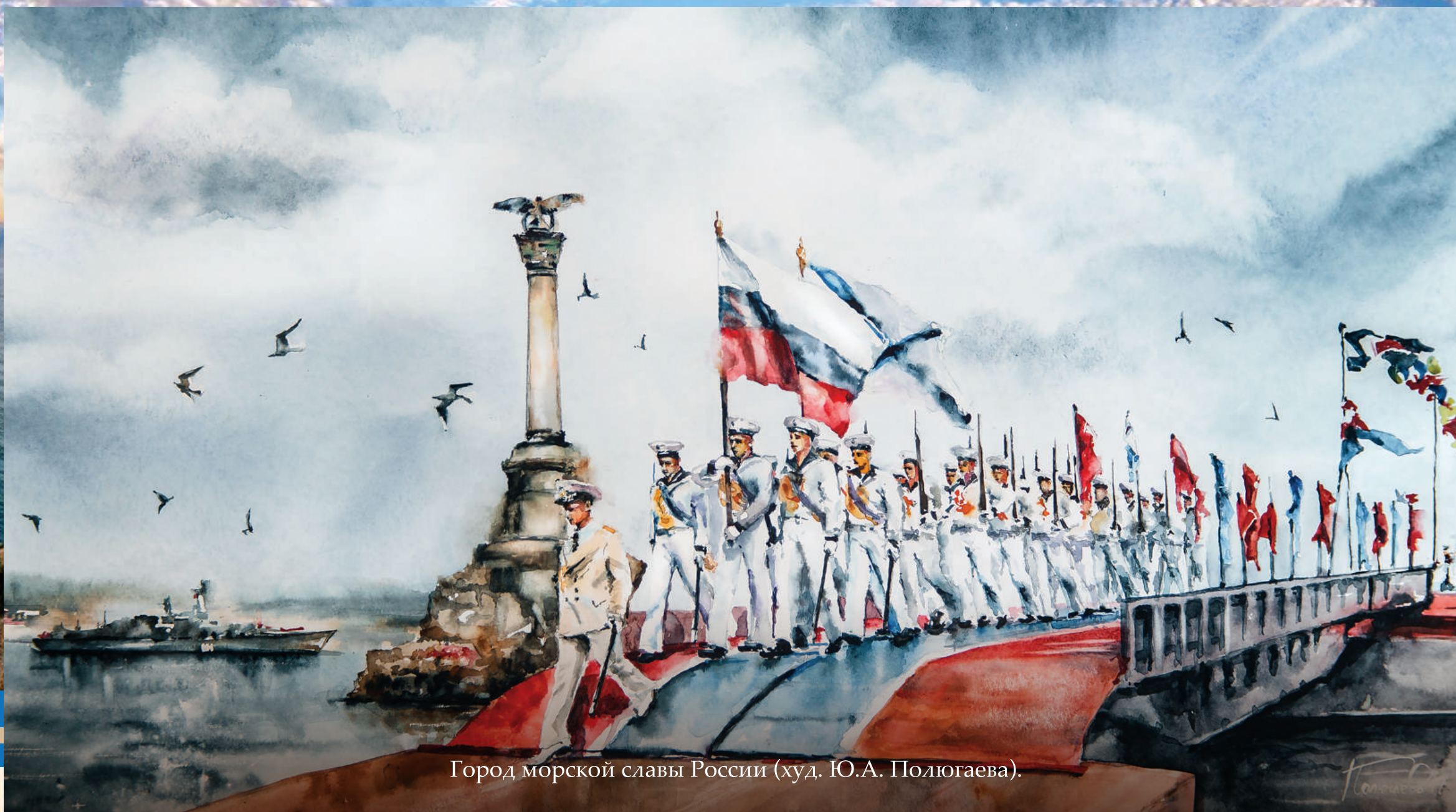
Город морской славы России (худ. Ю.А. Полюгаева).