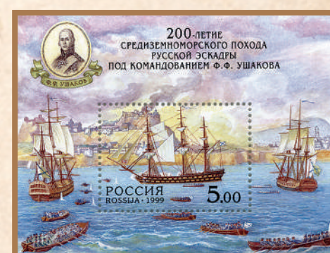
Почтовый блок с маркой 1999 года.

С принятием крымских земель в состав Российского государства сразу же началась активная работа по их включению в оборонительную систему южных рубежей империи и созданию Черноморского флота. Именной указ князю Г.А. Потемкину от 10 февраля 1784 года повелел обустроить или модернизировать большое число укреплений от Перекопа до Керчи. В отношении нового военно-морского форпоста России следовало особое предписание – построить «крепость большую Севастополь, где ныне Ахтияр и где должны быть Адмиралтейство, верфь для первого ранга кораблей, порт и военное селение».