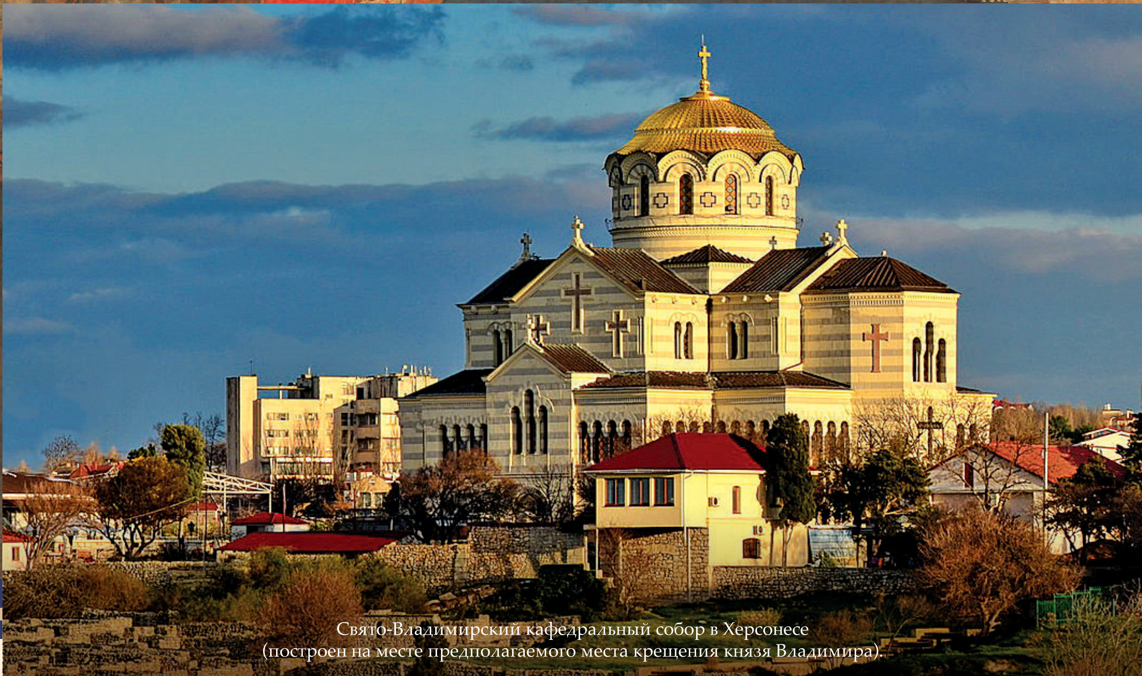
Свято-Владимирский кафедральный собор в Херсонесе (построен на месте предполагаемого места крещения князя Владимира).