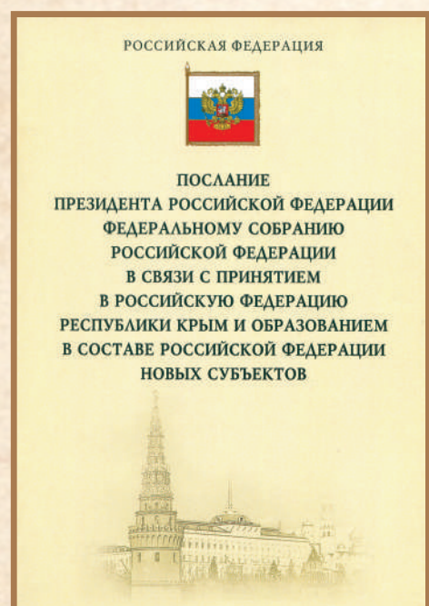
Послание Президента Федеральному Собранию 18 марта 2014 года.