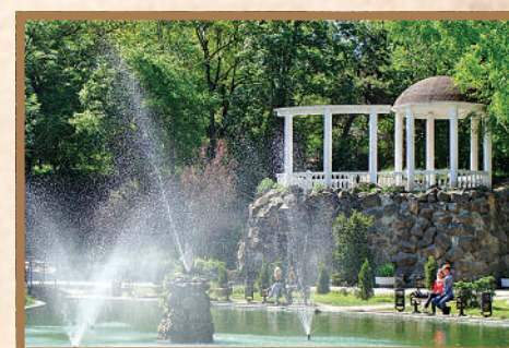
Парк культуры и отдыха «Екатерининский сад» в Симферополе.