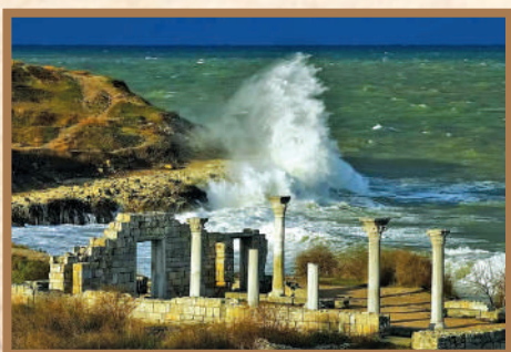
Ансамбль Херсонеса Таврического (Гагаринский район Севастополя).