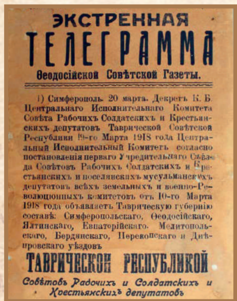
Телеграмма Феодосийской Советской газеты об образовании Таврической республики Советов рабочих и солдатских и крестьянских депутатов.