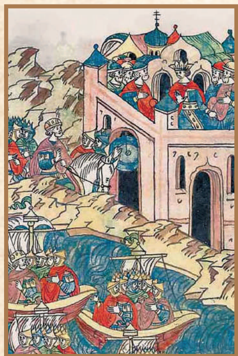
«И повесил Олег свой щит на вратах Царьграда» (миниатюра из Лицевого летописного свода).