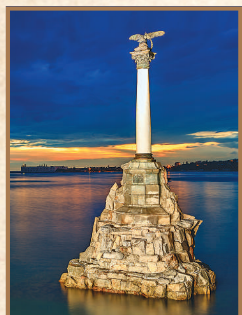
Памятник затопленным кораблям в Севастополе (авт. А. Г. Адамсон, В. А. Фельдман и Ф.О. Энберт).