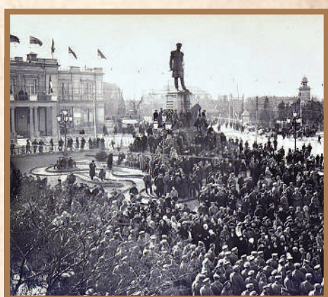
Митинг у памятника П.С. Нахимову в Севастополе (март 1917 года).