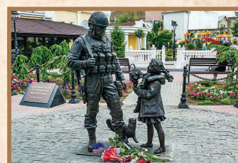
Памятник Вежливым людям в Симферополе.