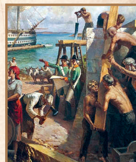
Начало строительства Севастополя (худ. А.Ф. Шорохов).