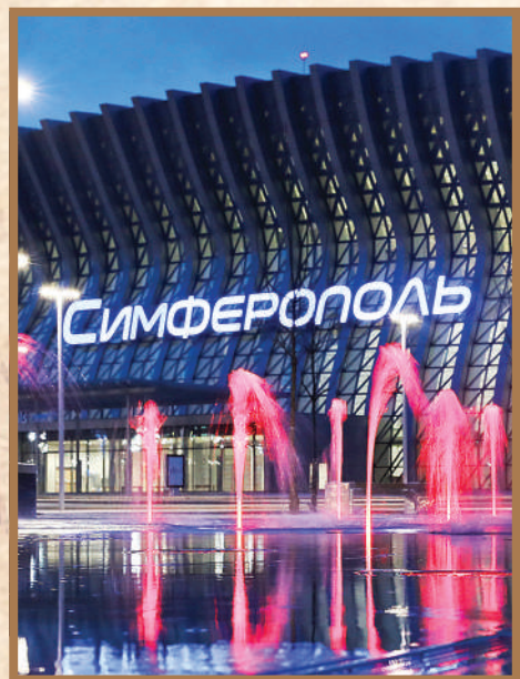
Новый терминал аэропорта в Симферополе.