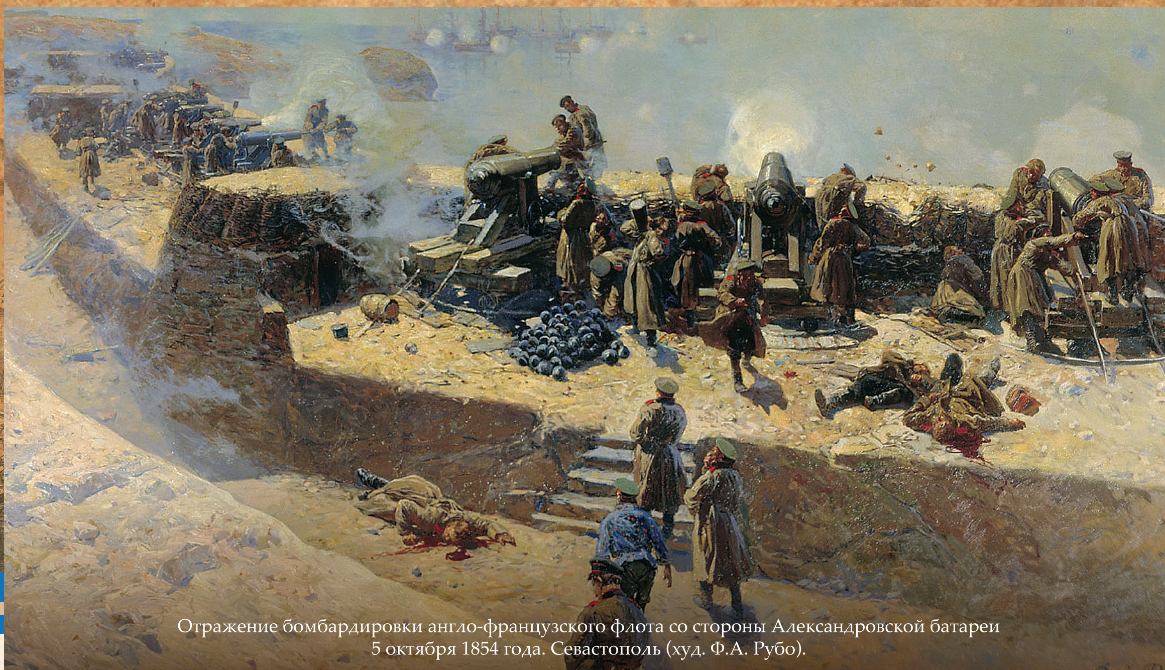
Отражение бомбардировки англо-французского флота со стороны Александровской батареи 5 октября 1854 года. Севастополь (худ. Ф.А. Рубо).