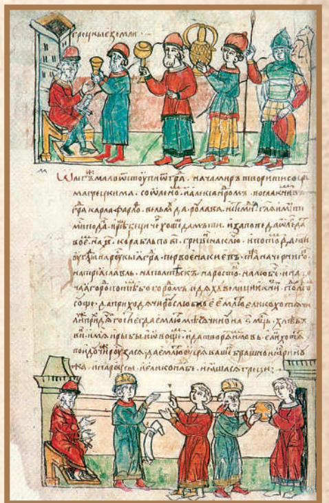
Русско-византийский договор 907 года (миниатюра из Радзивиловской летописи).

Благодаря внешнеполитическим достижениям на южных рубежах, молодое восточнославянское государство решает задачи по выходу к Черному морю. Укрепляется соседнее с полуостровом древнерусское Тмутараканское княжество, в состав которого включается город Корчев с округой. Длительное время земли по обеим сторонам Керченского пролива считаются русскими землями, и только во второй половине XII века Тмутараканское княжество исчезает под ударами половцев. В следующем столетии монголо-татарское нашествие надолго отрывает Крым от русской культуры и русского влияния.