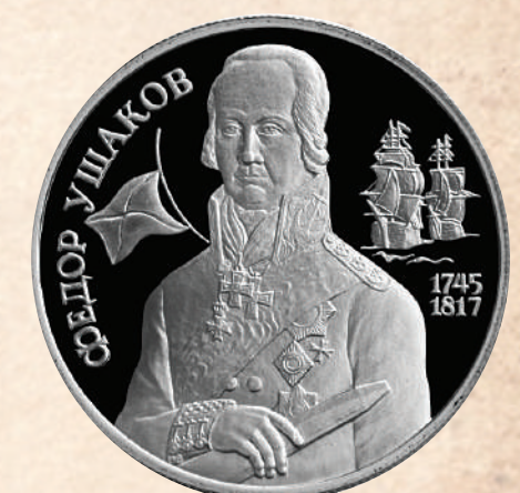
Памятная серебряная монета Банка России, посвященная Ф.Ф. Ушакову.