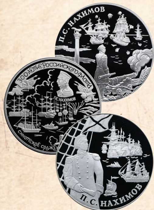
Памятные серебряные монеты Банка России, посвященные П.С. Нахимову и победе в Синопском сражении.