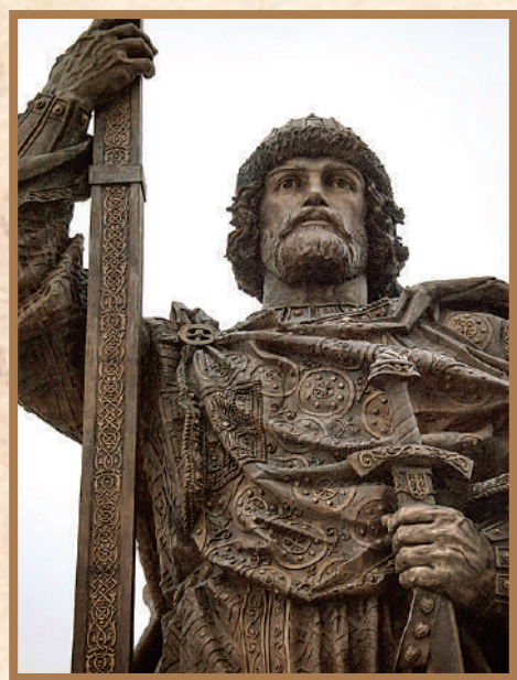
Фрагмент памятника князю Владимиру в Москве (автор проекта С. Щербаков).

Период VIII–X веков в истории Древнерусского государства стал временем активного формирования международных связей с соседними странами и народами. В орбиту военных, экономических, политических и культурных контактов на южном направлении попадают кочевые племена булгар, печенегов, хазар, территория Причерноморского бассейна и Византийская империя. Стремление молодого восточнославянского государства контролировать «путь из варяг в греки» и получать от него торговые выгоды становится причиной регулярных столкновений с могущественным южным соседом.