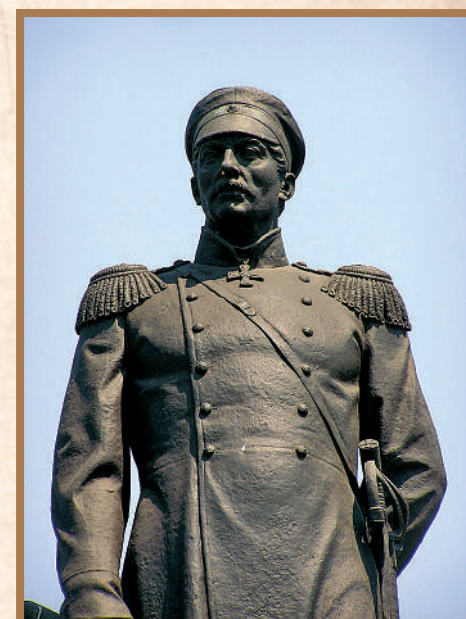
Памятник П.С. Нахимову в Севастополе.

Твёрдость внешнеполитической позиции России основывалась на воле миллионов людей, на общенациональном единении, на поддержке ведущих политических и общественных сил. Я хочу поблагодарить всех за этот патриотический настрой. Всех без исключения! Но нам важно и впредь сохранять такую же консолидацию, чтобы решать задачи, которые стоят перед Россией».