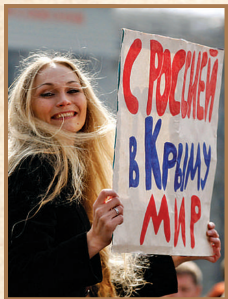
С Россией в Крыму мир!