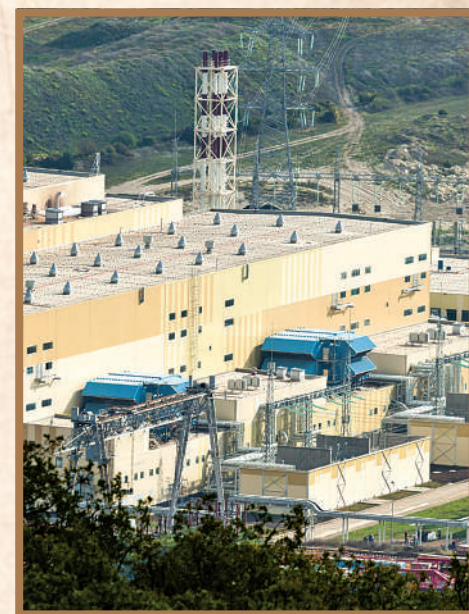
Балаклавская ТЭС в Севастополе.