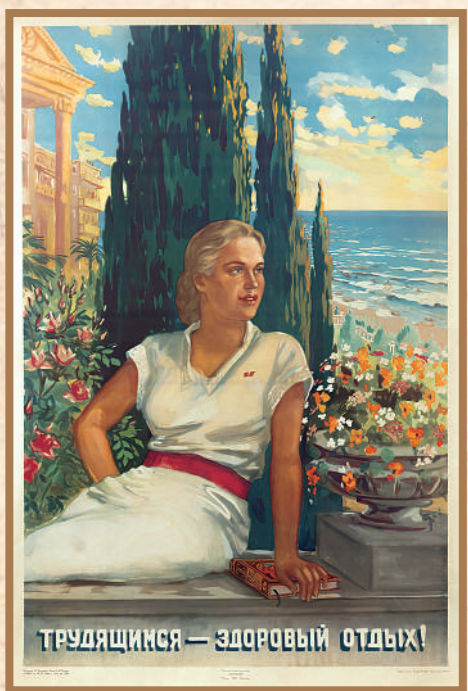
Плакат «Трудящимся - здоровый отдых!»

19 февраля 1954 года Президиум Верховного Совета СССР рассмотрел представление Президиумов Верховных Советов РСФСР и Украинской ССР о передаче Крымской области в состав Украины. Судя по стенограмме, все выступающие единодушно высказались в поддержку этого решения.