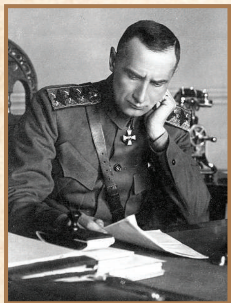
Адмирал А.В. Колчак.