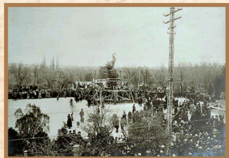
Открытие «Памятника Свободы» в городском саду Симферополя в честь освобождения Крыма (1921).

Великая Российская революция 1917-1922 годов прошла по стране испепеляющим огненным колесом и перевернула судьбы миллионов соотечественников на всем пространстве бывшей империи.