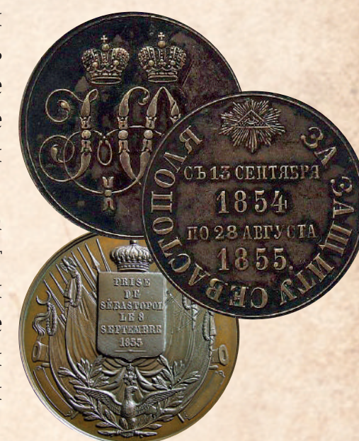
Российская наградная медаль «За защиту Севастополя» (учреждена Александром II в 1855 году) и французская наградная медаль периода Наполеона III за взятие Севастополя.

Оборона Севастополя стала одной из самых ярких и одновременно трагических страниц в истории Крымской или Восточной войны 1853-1856 годов, примером безаветного выполнения воинского долга, мужества и отваги, проявленных при защите рубежей Отечества. В ходе ожесточенных сражений за главный военно-морской форпост Российского государства погибли свыше 17 тысяч военнослужащих-соотечественников, почти 73,5 тысячи получили ранения и контузии, более трех тысяч пропали без вести. В списке павших героев особое место занимают имена прославленных адмиралов В.И. Истомина, В.И. Корнилова и П.С. Нахимова, ставших при жизни легендами Черноморского флота и возглавивших оборону Севастополя в один из самых тяжелых периодов его истории.