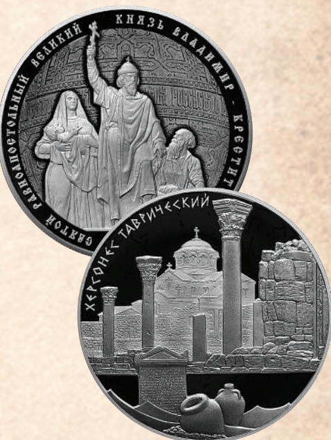
Памятные серебряные монеты Банка России.