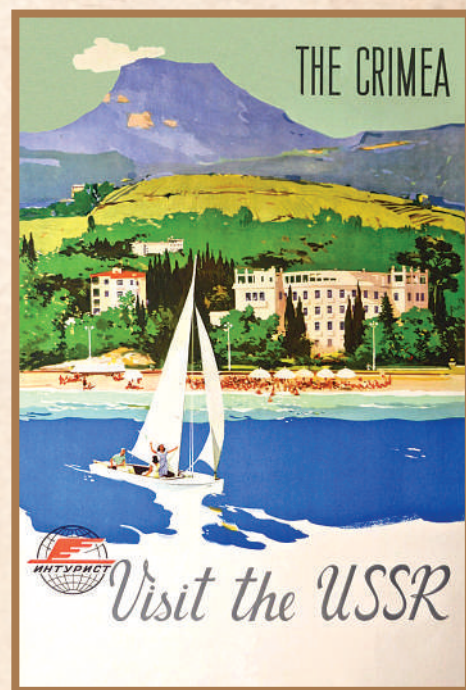
Плакат «Крым. Посетите СССР»