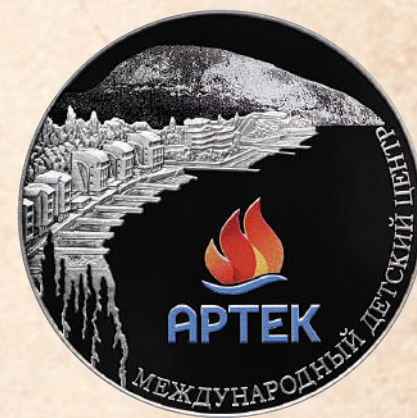
Серебряная монета Банка России, посвященная Артеку.